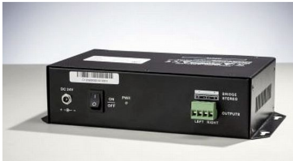
Abb. BA 2201 Digitalendstufe