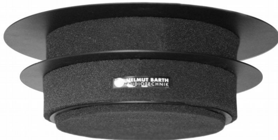
Abb. Ausführung in Schwarz.. ähnlich